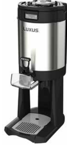
*S4S - 10/15 Alt Stand

Servis yüksekliğini ergonomik hale getirir, tezgâh üstü kullanıma uygun ve şık bir sunum alanı sağlar.