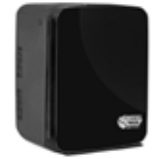
*Mini Süt Soğuk Tutucu