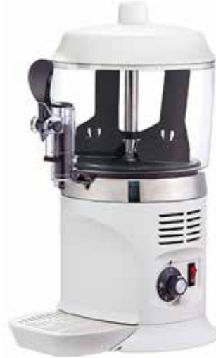
*SC-5 LUX Beyaz