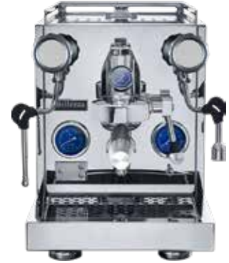
*Inizio R V2