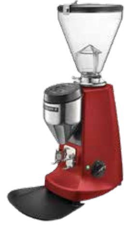
*Super Jolly V Up Electronic