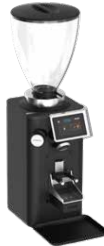
*Rev Titan Wam