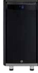
*Dual-Milk Süt Soğutucu