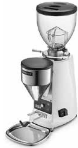
*MINI ELECTRONIC D