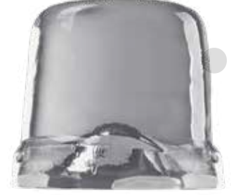
*35 (Ø) x 35 (22 Gr.)

Enerji ve çevre dostu: ISO 9001, CE sertifikaları; R452A / R290 çevre dostu soğutucu gazlar; su ve enerji tasarrufu optimize edilmiştir.