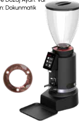
*Leon 800 RS