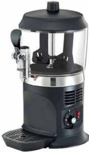
*SC-5 LUX Siyah