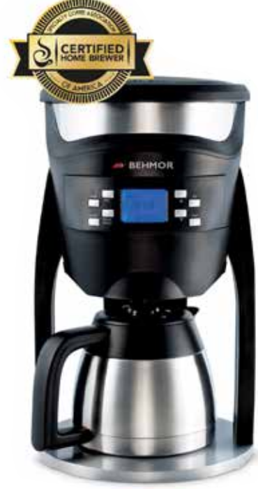
*BRAZEN PLUS 3.0