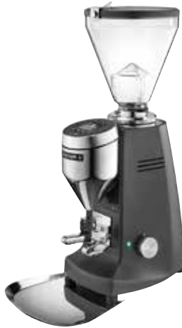
*Super Jolly V Pro Electronic