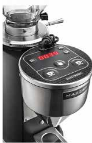
*MINI ELECTRONIC C