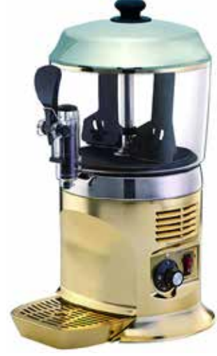
*SC-5 LUX Altın

Kompakt ve şık tasarımıyla kafe, restoran ve otel gibi profesyonel alanlarda kullanım için idealdir.