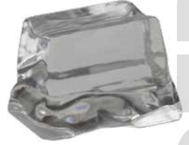
*26 x 36 x 23 (14 Gr.)