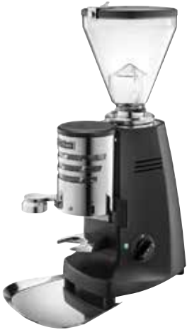
*Super Jolly V Pro Timer