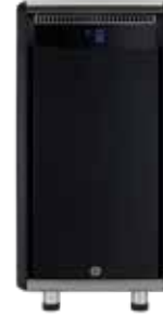
*Fincan Isıtıcılı Süt Soğutucu 9Lt.