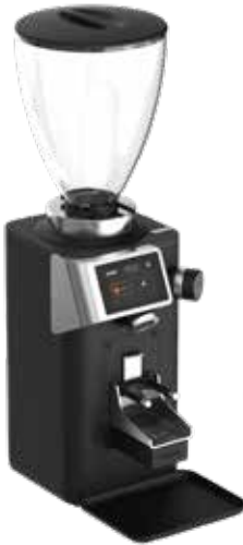
*Rev Zero Wam