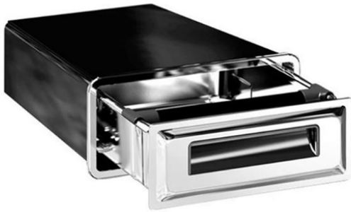
*Kasa Çekmecesi, AP-2812