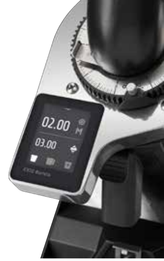
*E37Z Barista RS

Her iki model de farklı kullanım ihtiyaçlarına yanıt verirken, Ceado'nun üstün mühendislik kalitesi ve dayanıklılığını yansıtmaktadır.