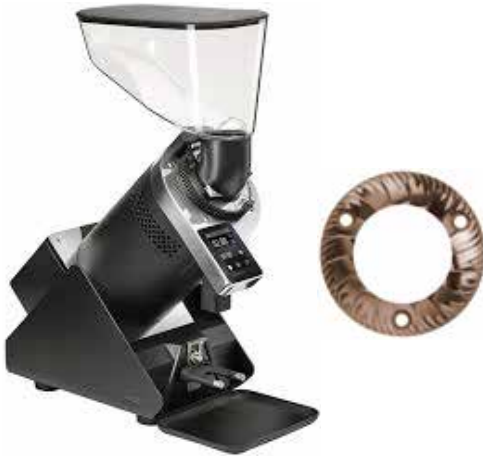
*E37Z Barista RS