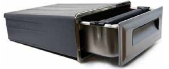
*Kahve Posa Tablası, AP-272