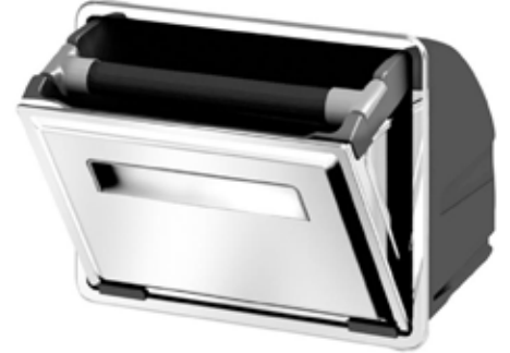
*Kahve Çekmecesi, AG-12