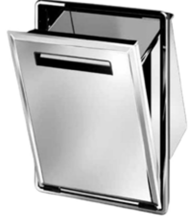
*Devirmeli Çöp Çekmecesi, AU-12