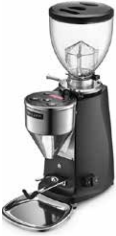
*MINI ELECTRONIC A