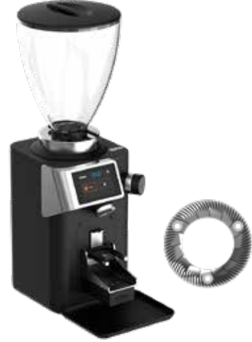
*Rev Steel Wam