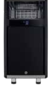
*Fincan Isıtıcılı Süt Soğutucu 4Lt.