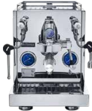
*Inizio R V2 Leva