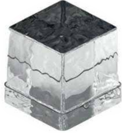
*2CUBE 90gr *50 mm x 50 mm x 50 mm